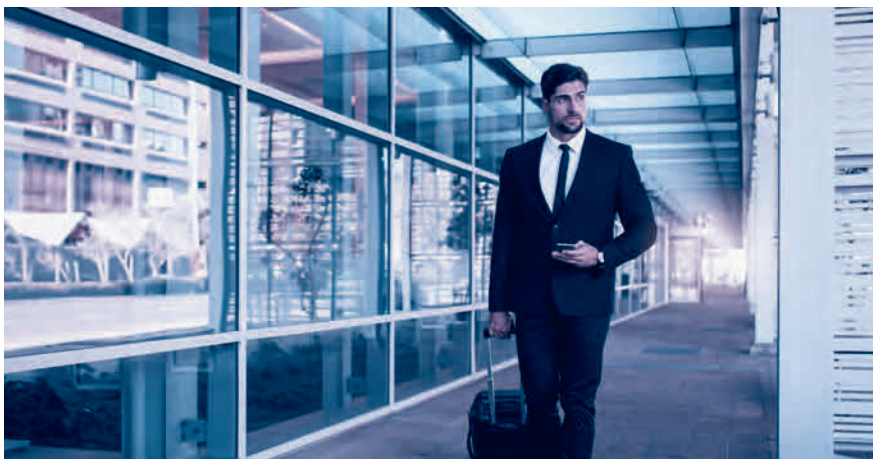
A1-Bescheinigung dabei? Sie ist für alle Aktivitäten im Ausland nötig.

entrichten hat. Es ist für sämtliche grenzüberschreitenden Tätigkeiten nötig, beispielsweise für Berater, Künstler, Journalisten oder Mitarbeiter im Transport oder Baugewerbe, und zwar auch dann, wenn der Aufenthalt nur wenige Stunden beträgt. Ausgestellt wird die A1-Bescheinigung von der AHV-Ausgleichskasse im Wohnsitzland des betroffenen Arbeitnehmers, beantragt wird sie vom Arbeitgeber des Entsandten bzw. direkt vom Selbständigerwerbenden.